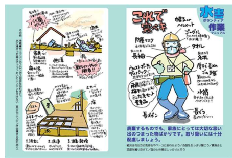
〔水害ボランティア作業マニュアル〕