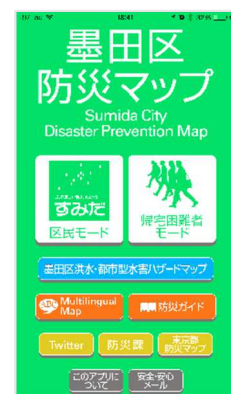
[墨田区防災マップ・アプリ]

本アプリでは、防災マップ、墨田区洪水・都市型水害ハザードマップのほか、各種防災情報の閲覧もできますので日頃の備えとしてご活用ください。