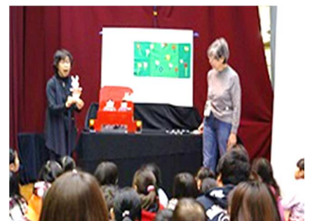
[おはなし会もあります]

ジャックボール（目標球）と呼ばれる白いボールに、赤・青のそれぞれ6球ずつのボールを投げたり、転がしたり、他のボールに当てたりして、いかに近づけるかを競います。