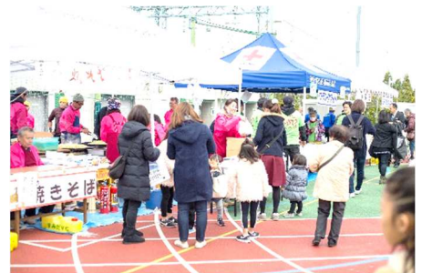
【やきそば・フランクフルト】