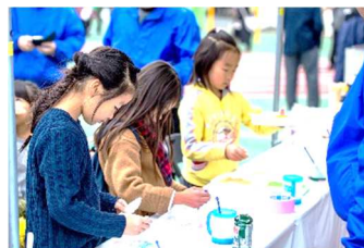
【お絵かきせんべい】