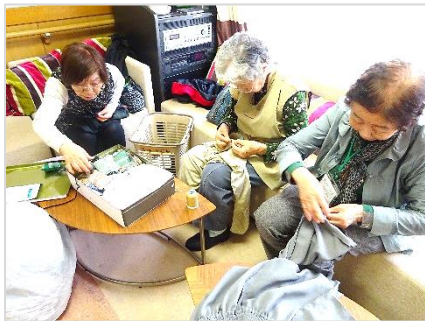
[ズボンの裾を繕い中]

今日は、特別養護老人ホーム「なりひらホーム」で行われたボランティア入門講座を見学しました。参加者はほとんどがボランティア経験者で、それぞれの活動の話を伺いました。折り紙の講師をしているという男性は、今後は紙芝居をやってみたいと話していました。他のホームで習字の手伝いを週1回しているかた、なりひらホームで繕いものを10年以上しているかた、運転ボランティアをされているかた、皆さん頑張っています。