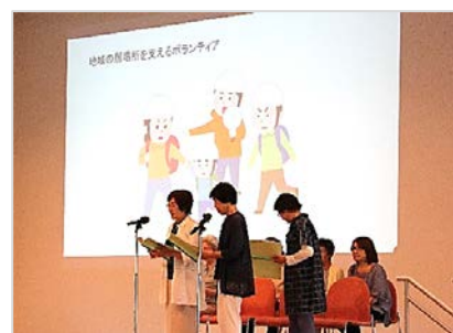
〔ボランティアフォーラム2017〕