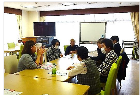
[ボランティア説明会]

なりひらホームでは、「夏！体験ボランティア」の受け入れをしています。利用者の話し相手、車イス清掃、中庭の水やり（夕方のみ）、レクリエーションと一緒に参加して下さるかた、早朝やお昼に配膳を手伝ってくださるかたを募集しています。ボランティアに関心のあるかたはお話だけでも聞いてみてはいかがでしょうか。