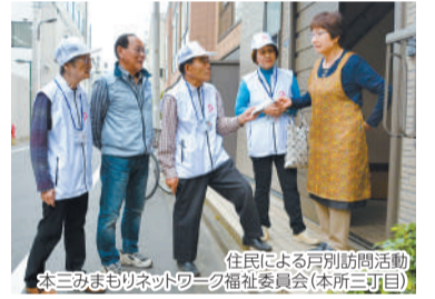
住民による戸別訪問活動 本三みまもりネットワーク福祉委員会(本所三丁目)

小学校や児童館などを活用し、複数の町会・自治会エリアを対象として、どなたでも気軽に集まることが出来る「拠点型ふれあいサロン」を、引き続き区内4か所で実施します。更には、この活動を通して、地域福祉活動の担い手を育成していきます。