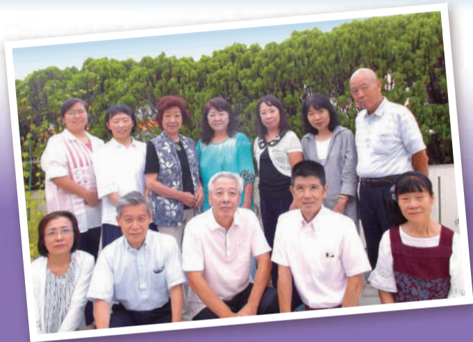
▲平成29年度受講生のみなさん

市民後見人とは、親族や専門家ではなく、一定の研修を修了した区民の方がなる成年後見人のことです。主な活動は、判断能力が十分でない高齢者や障害者の代わりに、金銭管理や福祉サービスの契約などを行います。