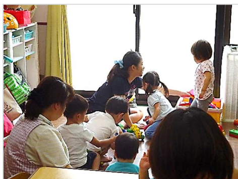
〔保育園で保育補助〕

【申込み】「2018 夏！体験ボランティア」に参加するには、『事前説明会』への参加が必要です。 いずれかの説明会に必ずご参加ください。 ⇒ 説明会日程表は 6 面です。