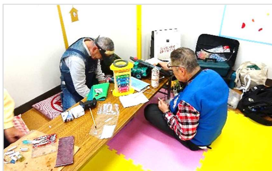
[ おもちゃドクターが診療・治療中 ]