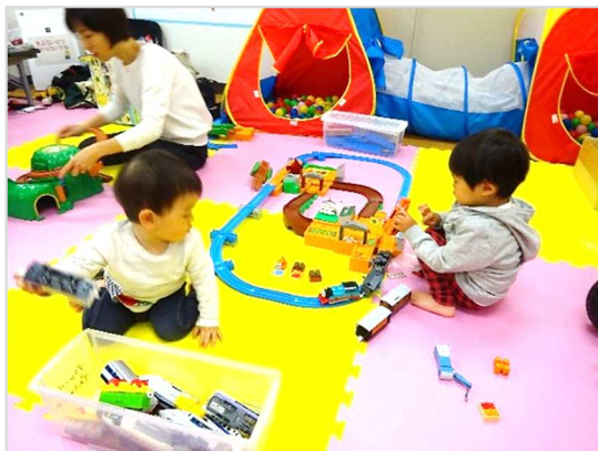
[ プラレールの電車を走らせよう ]

おもちゃサロンは、「障害のある子どもたちにおもちゃの素晴らしさとおもちゃの楽しさを」との願いから始まったボランティア活動です。現在は、障害のあるお子さん専用の時間を設けつつ、