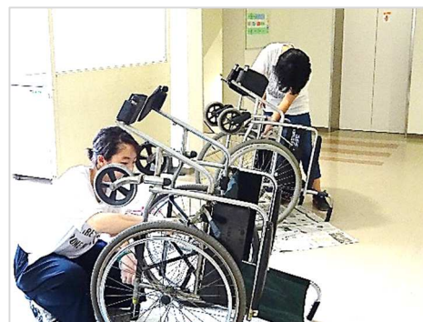
〔病院で車椅子清掃〕