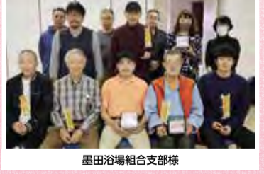
墨田浴場組合支部様