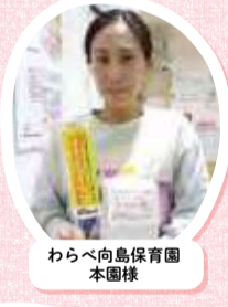
わらべ向島保育園 本園様