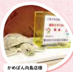
かめぼん向島店様