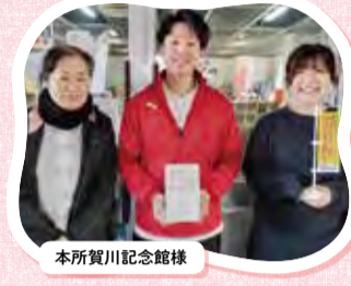
本所賀川記念館様