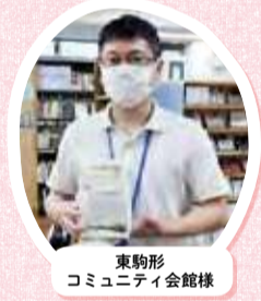
東駒形コミュニティ会館様