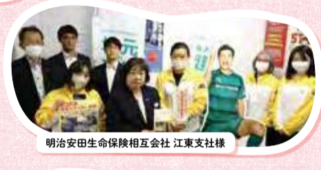
明治安田生命保険相互会社 江東支社様