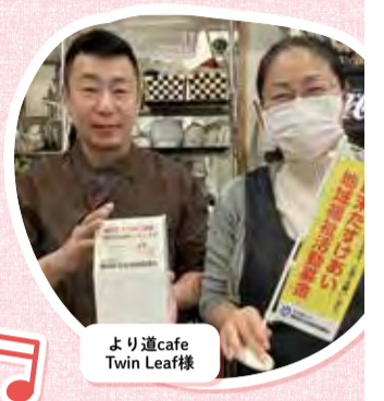
より道cafe Twin Leaf様