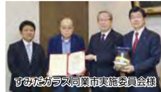
すみだガラス同業市実施委員会様