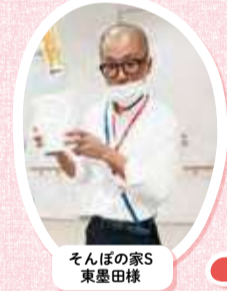
そんぼの家S 東墨田様