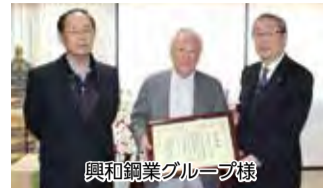
興和鋼業グループ様