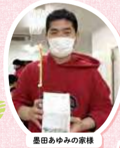
墨田あゆみの家様