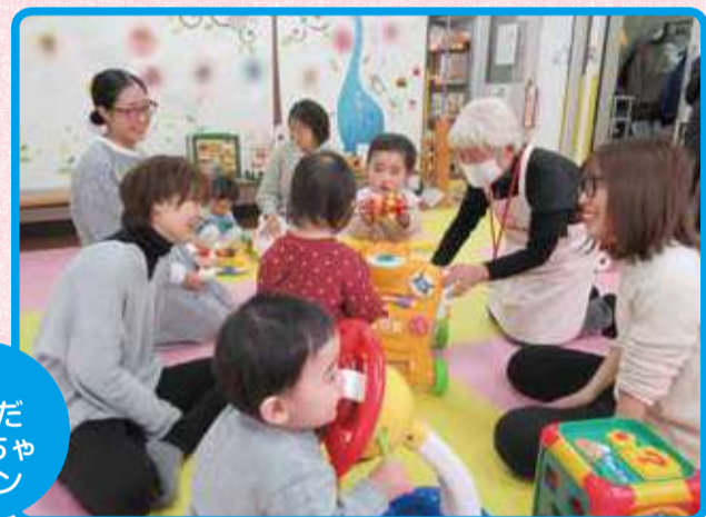
⑦ すみだおもちゃサロン