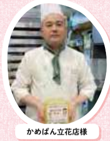
かめぼん立花店様