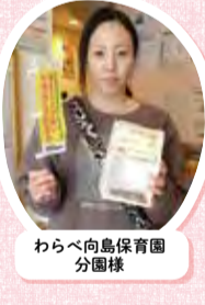
わらべ向島保育園 分園様