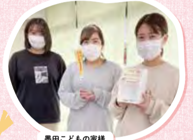
墨田こどもの家様