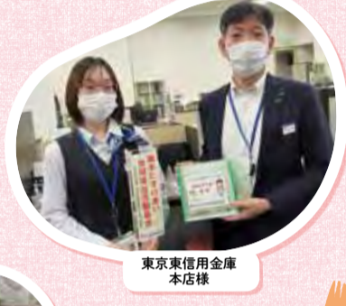
東京東信用金庫 本店様