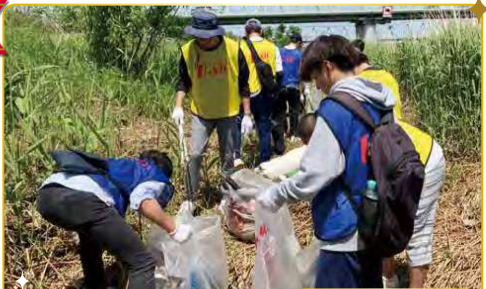
クリーンキャンペーンの様子

株式会社ユニックの社員有志が集まり 社員の心の成長と地域への貢献を目的と してボランティア活動をしています。これまで 荒川河川敷の清掃や、すみだボランティア センターのイベントの手伝い、災害ボラン ティア活動など精力的に活動しています。