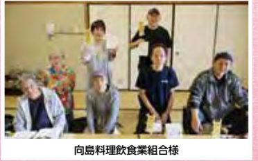
向島料理飲食業組合様

当協議会の募金箱を置いてくださる企業や店舗・施設を募集しています。 【問合せ】☎5655-8361