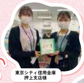
東京シティ信用金庫 押上支店様