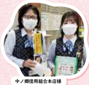
中ノ郷信用組合本店様