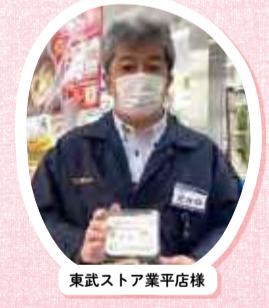
東武ストア業平店様