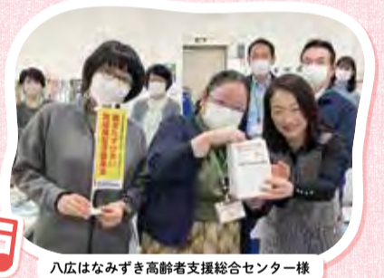
八広はなみずき高齢者支援総合センター様