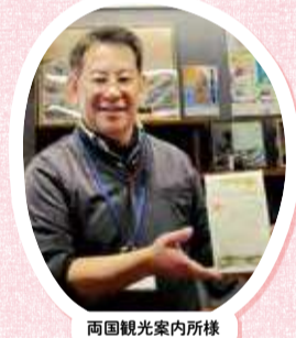
両国観光案内所様