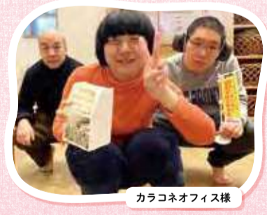
カラコネオフィス様