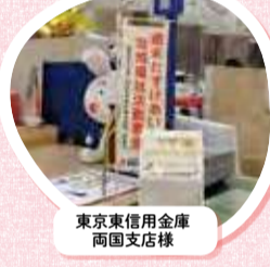
東京東信用金庫 両国支店様