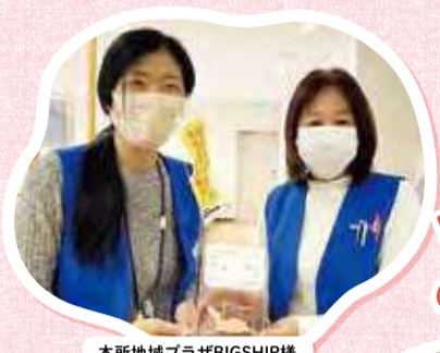
本所地域プラザBIGSHIP様