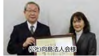
(公社)向島法人会様