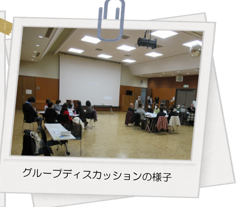
グループディスカッションの様子