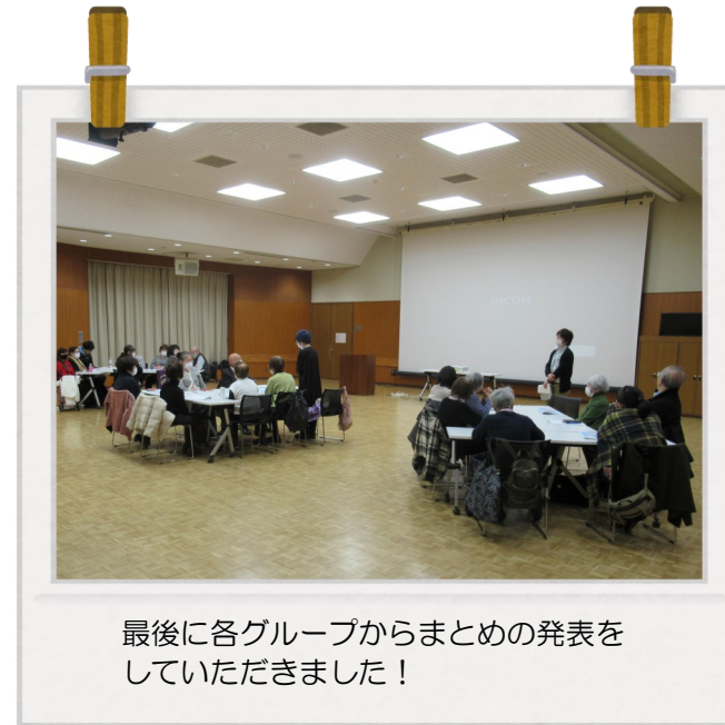
最後に各グループからまとめの発表をしていただきました！

「人生100年時代」という言葉が浸透する現代において、長寿社会の中での健康管理や質の高い睡眠の重要性がますます高まっています。このような背景のもと、昨年12月18日（水）曳舟文化センターにて、健康に関する知識とボランティア活動者同士の交流を深めるためのイベントを開催しました。