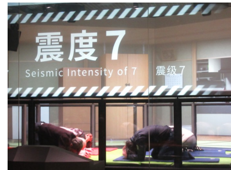
地震体験コーナー