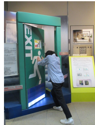
水圧で開かない扉を体験！