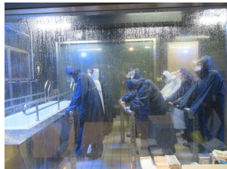
暴風雨体験コーナー

昨年12月3日（火）、本所防災館で13名の講座受講者のかたがたと災害について学びました。本所防災館は押上駅近くにある、防災に関する知識や技術を学べる体験施設です。本所防災館の地震体験コーナーと暴風雨体験コーナーは特に印象的で、地震体験では実際の揺れを感じながら正しい避難行動を学ぶことができました。一方、暴風雨体験では、強風と激しい雨の中での避難を体験し、自然災害の恐ろしさを実感しました。これらの体験を通じて、災害時に冷静に対処する方法とそれに対する備えを学ぶ貴重な機会となりました。