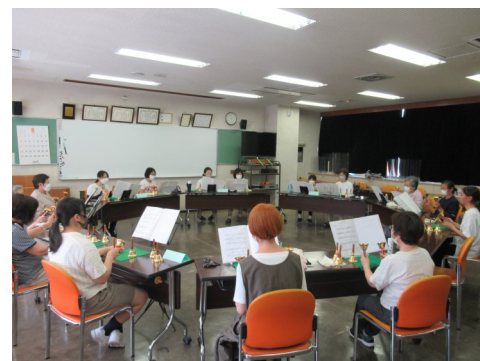
「ふれあいベルすみだ」の活動の様子