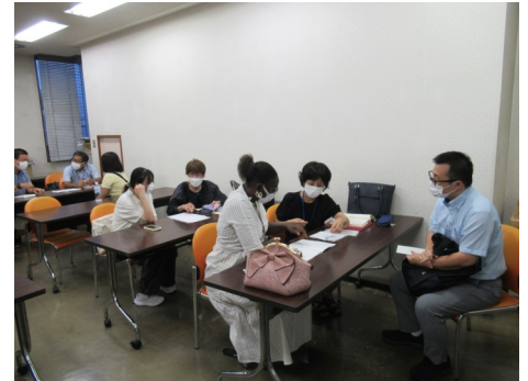
「すみだにほんごボランティア21」の活動の様子