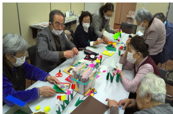
ぷらっと本所の折り紙教室の様子

予約なく「ぷらっと」きて、のんびりと 過ごせます。 また、困りごとがあれば気軽に相談も できる専門職が居る、地域の交流と 相談の場所です。