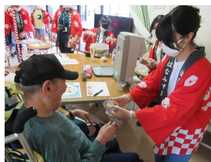
高齢者施設での活動の様子