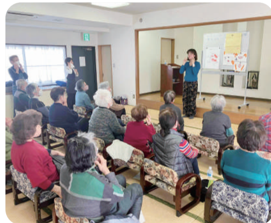
▲押上文花町会チームみまもり「声磨き®」の様子