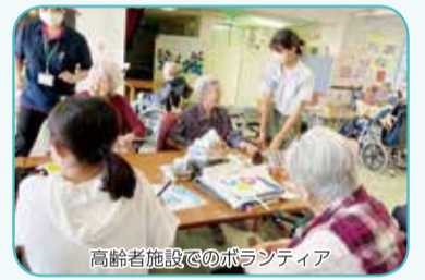
高齢者施設でのボランティア