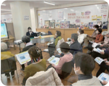
▶健康と眠りを考える『睡眠ゼミナール』実践講座

八広5-18-23 (八広はなみずき高齢者支援総合センター内) 毎週火曜日・木曜日 午前11時～午後4時