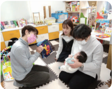
▶定期イベント『お子さん向け読み聞かせ』