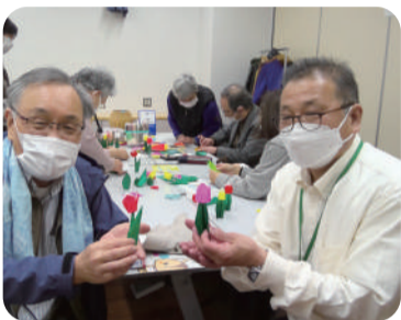
▶定期イベント『折り紙教室』

本所1-13-4 (本所地域プラザBIG SHIP 1階) 毎週月曜日・水曜日 午前11時～午後4時 (第3月曜日は休み)