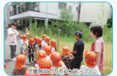
児童施設でのボランティア

【参加者説明会 申込み】6月3日(月)午前9時からホームページの申込フォームまたは平日の午前9時～午後5時半までに☎3612-2940までお申込みください。