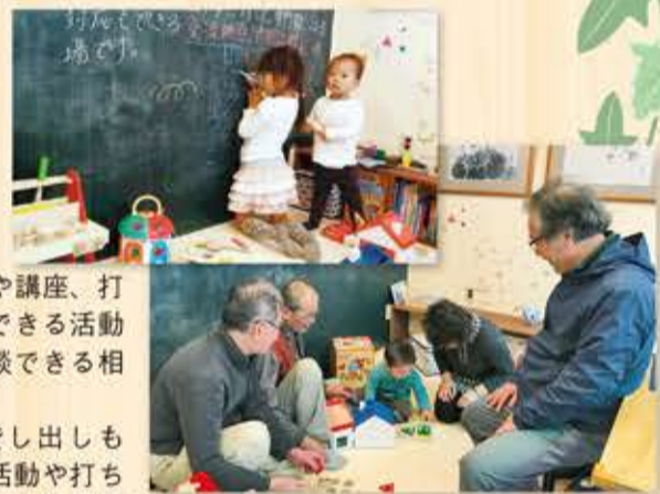
(交流室) あらゆる世代の方が立ち寄り交流できる場です