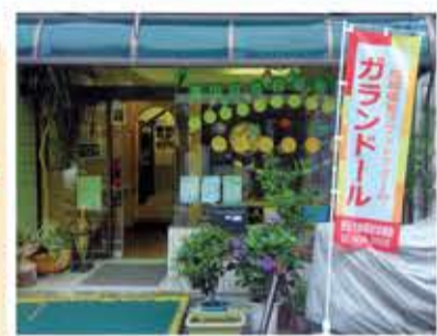
旗を目印にお気軽にお立ち寄りください

活動室は部屋の貸し出しも行っていきますので、活動や打ち合わせをお考えの方はお気軽にお問い合わせください。