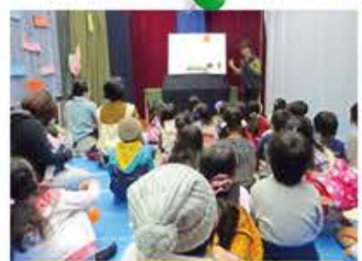
ボランティアまつりのおはなし会