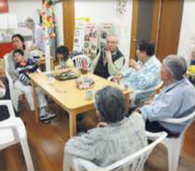
フラッと立ち寄りおしゃべりができる場です

毎月第4水曜日には「街かど食堂」を開催しています(くわしくは8面「イベント情報コーナー」をご覧ください。)