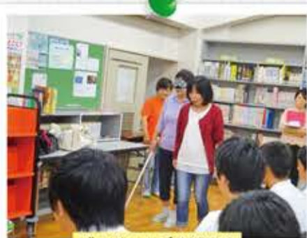
ガイドヘルプ体験講座