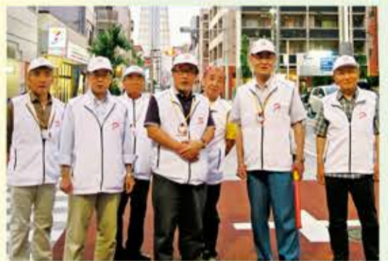
小地域福祉活動(太巻まもりネットワーク福祉委員会)

本年7月現在、小地域福祉活動が29地区で、ふれあいサロンが23地区で、拠点型ふれあいサロンが4か所で行われており、いずれも立ち上げからその後の活動、運営など全般にわたり、民生委員の皆様にも深く携わっていただいております。