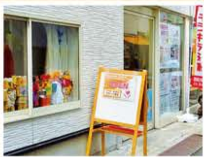
キラキラ橋商店街から入ってすぐのところですよ

毎月第2火曜日の午後2時～4時は、同場所で「茶ちゃサロン」も開催しています。どなたでもご参加いただけますので、サロンにもお気軽にお越しください。