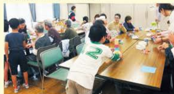
拠点型ふれあいサロン(第三吾嬬小学校)

*上記事業のほか、ボランティアセンター事業、権利擁護センター事業、すみだハートライン21事業でも、多くの民生委員・児童委員の皆様にご協力いただいております。