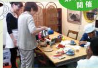
挽きたてのコーヒーを提供しています

【とき】 8月23日(水) 午後1時半～3時半 【ところ】 ガランドール 【費用】 無料