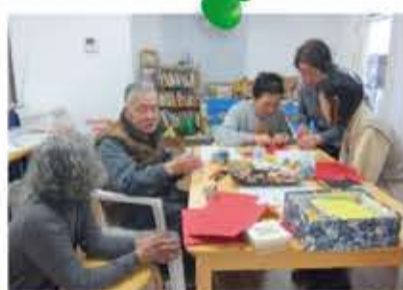
地域福祉プラットフォーム (京島三丁目)