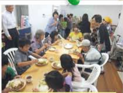
世代間交流の場である街かど食堂