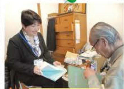
市民後見人による支援