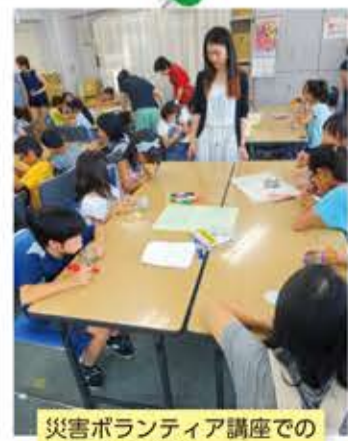
災害ボランティア講座での 防災ランプ作り