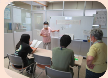
すみだ点訳ひかり会