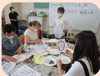
おはなしの会つくしんぼ