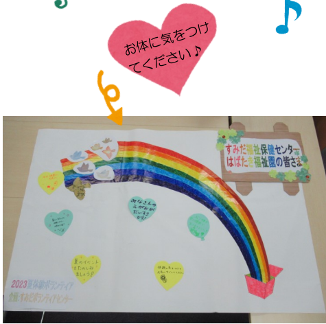
はばたき福祉園（障害者施設）に送る壁画

施設のご利用者・職員の皆さまに向けて、夏体験ボランティアの参加者がメッセージカードを書き、張り付けたものを寄贈します。