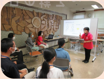
手話サークル「すみだ」