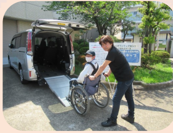
ハンディキャブ体験