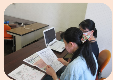
すみだ録音グループ「声」