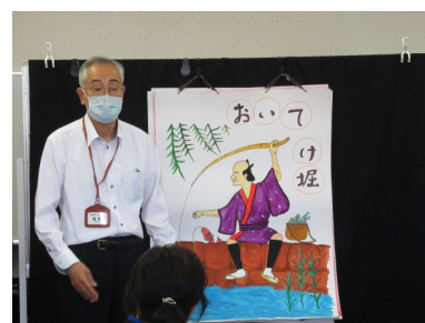
朗読奉仕くさぶえ