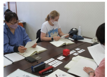
すみだにほんごボランティア21