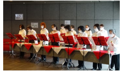
ふれあいベルすみだ

ミュージックベルの演奏と合唱、ベル体験をとおして高齢者や障害者の方々との交流を図る。