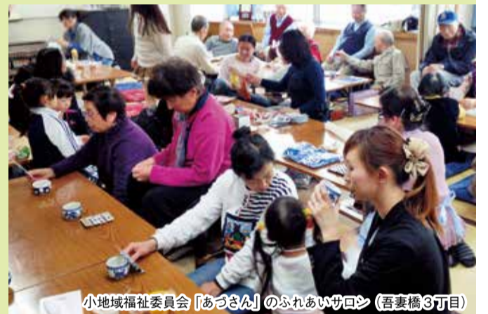
小地域福祉委員会「あつさん」のふれあいサロン (吾妻橋3丁目)