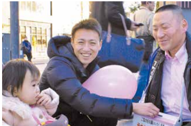
昨年の街頭募金の様子 (協力:一般社団法人建築ビジョン)

寄せられた募金は、在宅で生活している重度の障害がある方への見舞金をはじめ、さまざまな地域福祉事業に活用させていただきます。