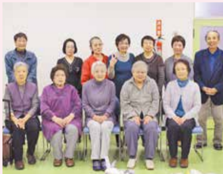
今年で10周年を迎えました。

毎年この時期には、募金をされた方へのプレゼントとして、アクリルたわしや広告で作られた手提げ袋など、手作りの品物を社協にご寄附いただいています。