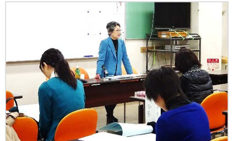
〔音訳講習会開講式〕