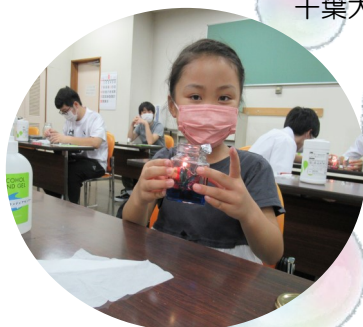
災害ボランティア講座