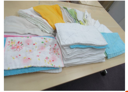
手作りそうきん寄贈