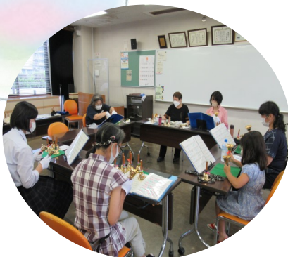
ふれあいベルすみだ