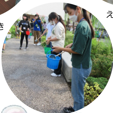
千葉大学環境ISO学生委員会