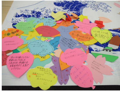
寄せ書き付き壁画作成