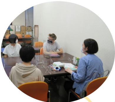
すみだにほんごボランティア21