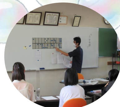
すみだ点訳ひかり会