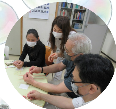
にほんご教室ようこそ