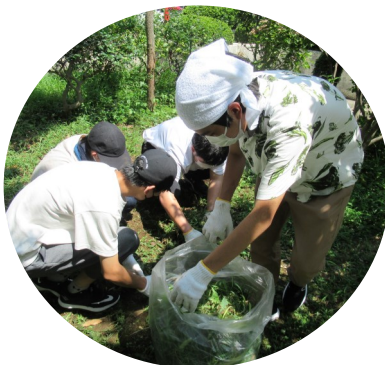
花壇ボランティア