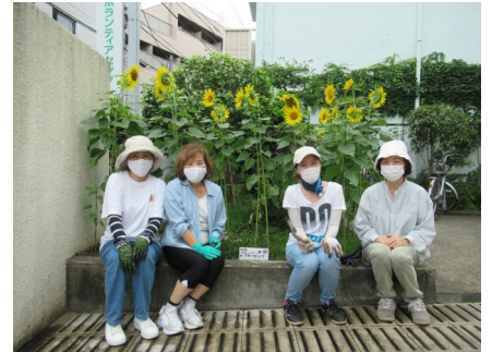
花壇ボランティアの皆さま