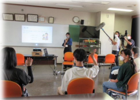
SDGs や環境に関するクイズ大会