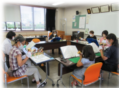
音のタイミングが合えば一体感が生まれます