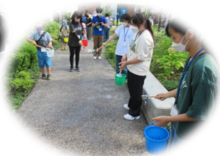
町内会の方と打ち水を行いました