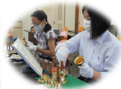
音を分担して演奏