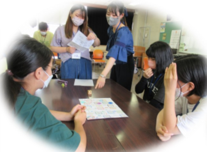
環境問題を学べるすごろく