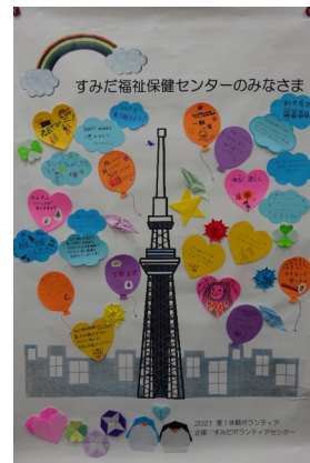
寄せ書き付き壁画 昨年度の作品

ご自宅にある不要なタオルでぞうきんを作り、郵送もしくはご持参ください。どのような大きさでも大丈夫です。