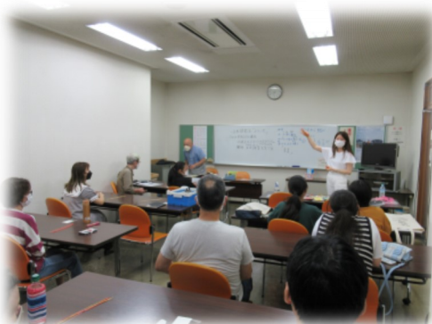
在日外国人の方々との交流の場