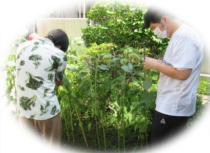
ひまわりの種のネット掛け