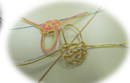
水引きは日本の伝統文化の一つです