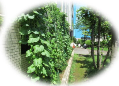
緑のカーテンの水やり