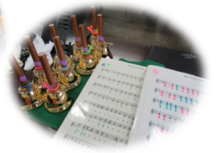
誰もが知っている楽曲を選びます