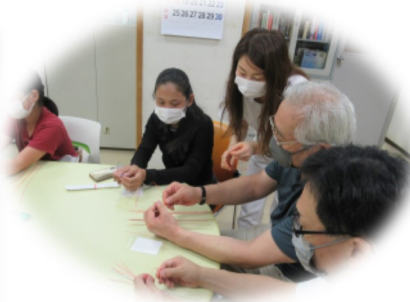
水引き（あわじ結び）作り