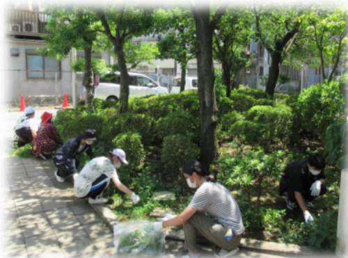
花壇の草取りをしました