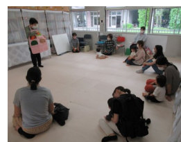
【おはなしの会つくしんぼ】