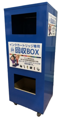
インクカートリッジ