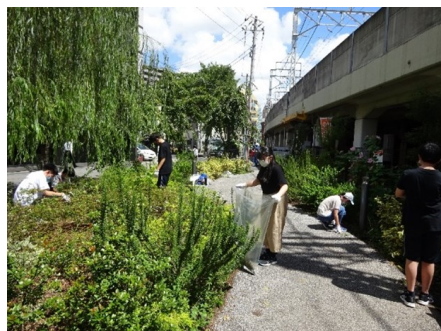
花壇ボランティア活動体験