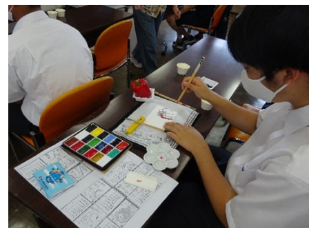
絵手紙づくり体験