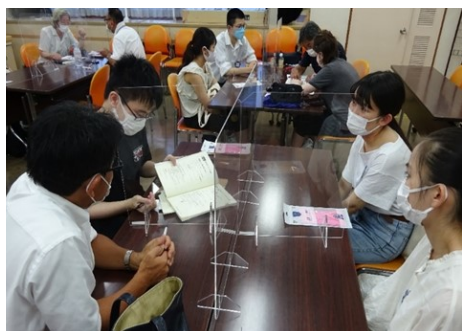
日本語指導ボランティア活動体験