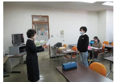
[令和3年度 点訳講習会修了式]