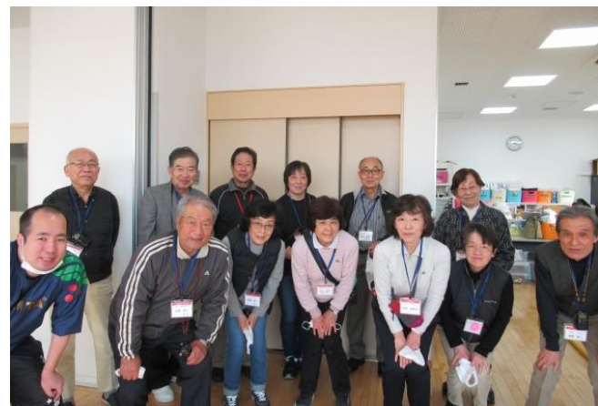
[スタッフの皆さま]