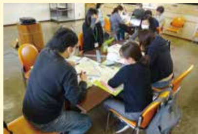
—昨年の災害ボランティアセンター立上訓練の様子

全社協では、地元関係者が主体となった災害ボランティアセンターの運営を推進するため、都道府県・指定都市社協と連携して、モデル研修を全国4～6か所で実施しており、関東ブロックの代表として墨田区が選ばれました。