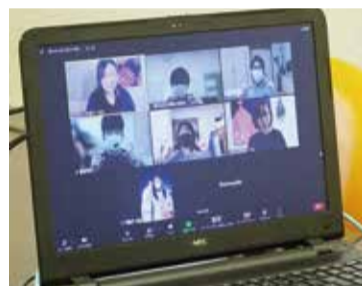
オンライン体験会の様子