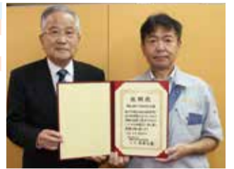
明るい社会づくり墨田区民の会様