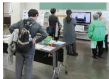
活動紹介のビデオを見る皆さん

今年も多くのボランティアの皆さんのご協力のもと、開催することができました。ありがとうございました。