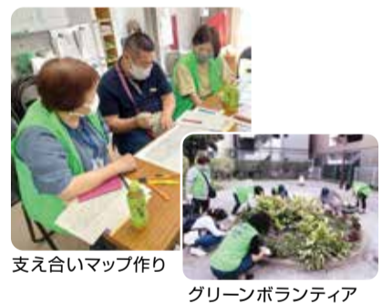
支え合いマップ作り

当委員会は、平成29年にどなたでも集える場所としてふれあいサロンを立ち上げ、令和2年に地域での見守りを強化するために小地域福祉委員会へ移行しました。皆さんでお揃いのユニフォームを着て、見守り活動を行っています。また、地域でのつながりを見える化するために「支え合いマップ作り」も行っています。最近では、町内4か所に植物を植える活動も始めました。子どもから高齢者まで、みんなで自分の町をきれいにしています。