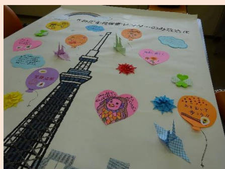
寄せ書き付き壁画