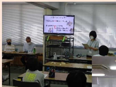
災害ボランティア講座