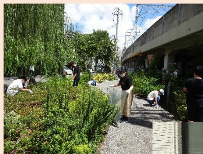
花壇ボランティア