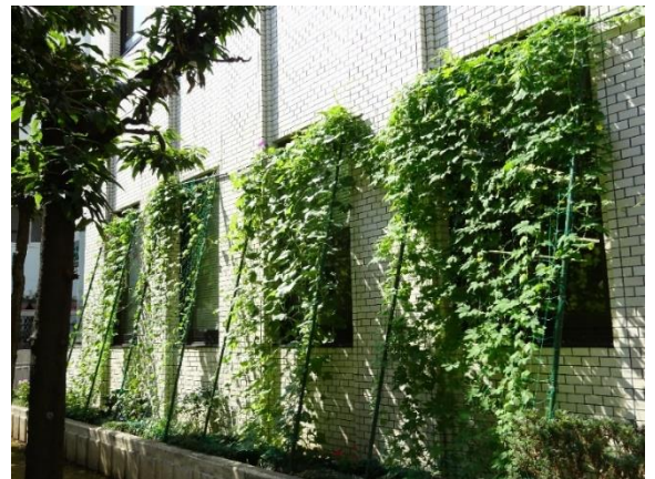
⇒2020年度「緑のカーテンコンテスト」 伝説のカーテン部門受賞作品

今回番組では、夏に気を付ける点や、夏に備える情報の紹介として、暑熱対策として効果的な植物のカーテンの取り組みを積極的に行っている花壇ボランティアの皆さんが取材を受けました。