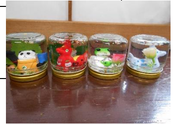
◀昨年度作成のスノードーム▶