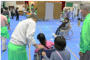
⇒ボランティアまつりの様子