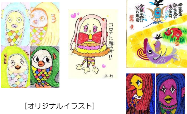
[オリジナルイラスト]

新型コロナウイルス感染拡大防止とその終息を願う中、脚光を浴びた妖怪アマビエ。すみだボランティアセンターでも、「アマビエチャレンジ」と称して、オリジナルイラストやぬりえを募集し、集まりました作品を館内に掲示しています。