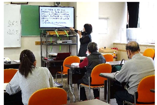
[要約筆記講習会の様子]