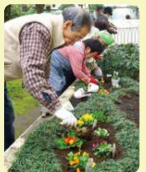
花壇ボランティア 花の植替え

いただいた募金は、登録されているボランティアの皆さんに、充実した活動をしていただくための備品の購入等に活用されています。