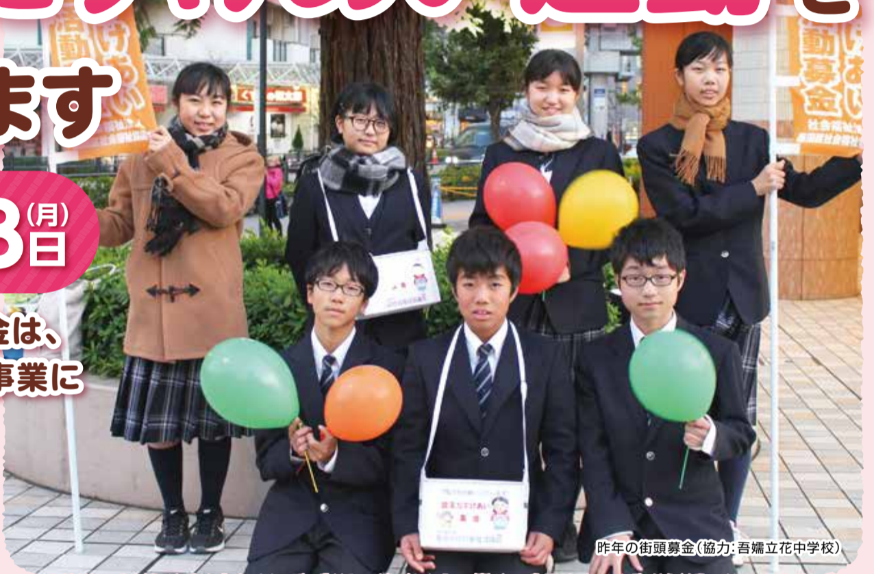
昨年の街頭募金(協力:吾妻立花中学校)

お寄せいただいた募金は、 全額墨田区内の福祉事業に 活用されます。 みなさまのご協力をお 願いいたします。