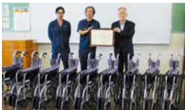
誠進工業 有限会社様