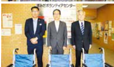
ひがしんビジネスクラブ「オーロラ」本店支部様 ひがしん本店みのり会 東京東信用金庫本店様

その他紙オムツなど多数 (社協が仲介した寄附物品については掲載していません。ご了承ください。)