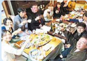
岡さんのいえTOMOでの交流風景