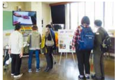
パネルや活動DVDを熱心に見る皆さん

「今、できること」を考えながら、今年も多くのボランティアの皆さんのご協力のもと、開催することができました。ありがとうございました。