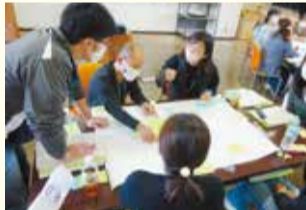
グループでみんなの意見を出し合います

社協の役割は、「住み慣れた地域で自分らしく生活するためにできること」を共に考え、見つけ、支えることです。災害時であっても、それは変わりません。「なぜ社協が災害ボランティアセンターを運営するのか」ということも再確認できた訓練でした。