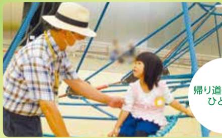
帰り道の公園でひと遊び

すみだファミリー・サポート・センターは、子育ての手助けを必要とする方と、お手伝いができる方をつなぐ、地域の支え合いの事業です。「下の子が産まれるので、上の子の保育園にお迎えをお願いしたい」「初めての子育てで不安、一緒に子どもを見て欲しい」