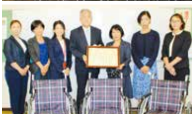
第一生命 城東営業オフィス様