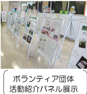
ボランティア団体活動紹介パネル展示