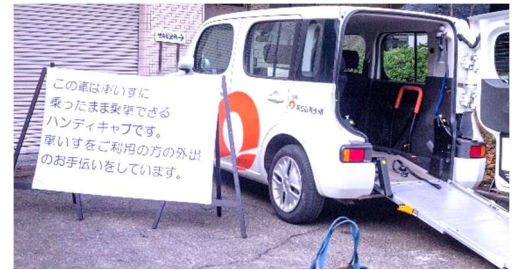
[ハンディキャブ紹介]

3階の会場ではボランティア団体の活動紹介パネルや作品の展示、活動風景のビデオ放映、団体バザーを行いました。