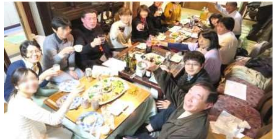
（岡さんのいえ TOMO での交流風景）

【申込み】 すみだボランティアセンターへ、 電話かホームページからお申込みください。