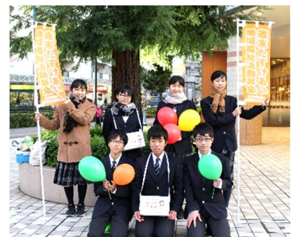
[昨年の街頭募金(協力) 吾孺立花中学校]