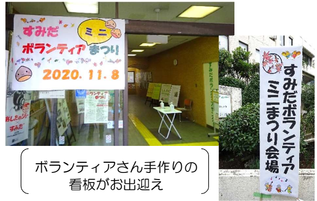
ボランティアさん手作りの看板がお出迎え