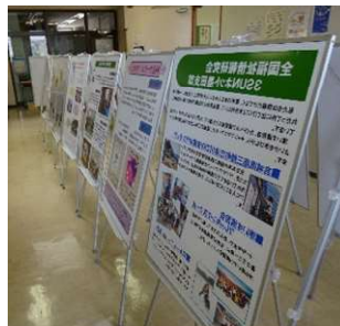
[ボランティア団体紹介]

【申込み】 すみだボランティアセンターへ、 電話か FAX でお申込みください。