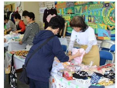
[ボランティア団体バザー]