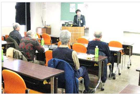
[年に2回安全運転講習会を行っています]

運転は家族や知人が行いますが、利用者の中には運転者の確保が難しい場合があります。そのような場合には、運転ボランティアの紹介をします。