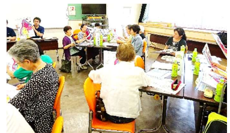
〔前回 交流会の様子〕