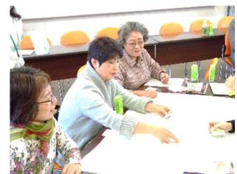
〔前回「精神保健福祉ボランティア講座」〕