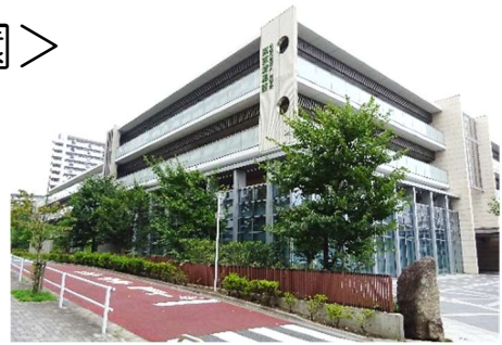
〔立花小学校跡地に建てられました〕

今回の入門講座に来られたかたがたに参加の動機を伺ったところ、「東京清風園に興味をもったから」、「どんなボランティア活動があるのか、未経験なので知りたかった」、「児童関係のボランティア活動をしたことがあるが、高齢者施設ではどんなボランティアがあるのか知りたかった」などの声がありました。