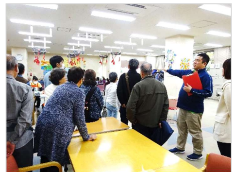
〔施設見学の様子 (前回開催時)〕